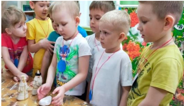
жители озера Байкал