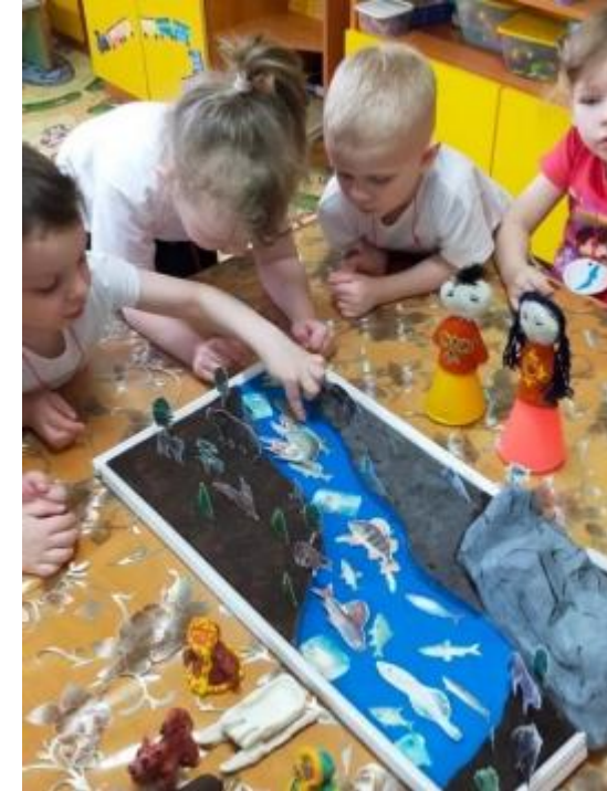
макет озера Байкал